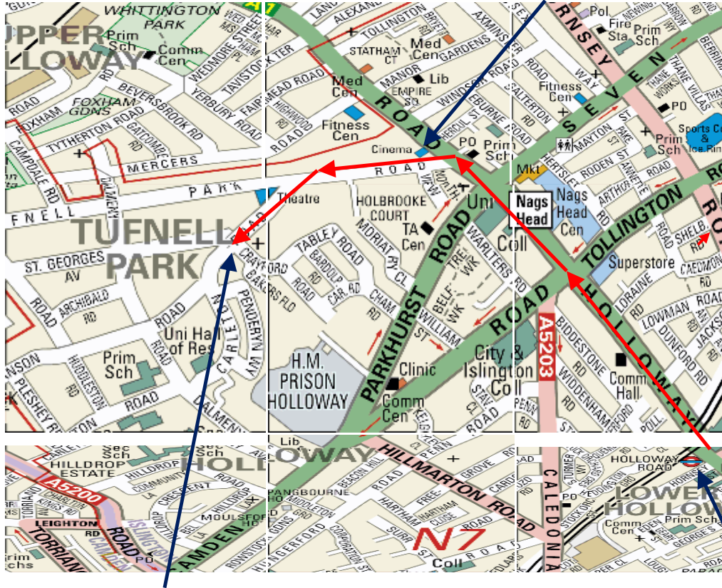
Fig.4. የሆሎዌይ አካባቢ የመንገድ ካርታ ( Holloway Area Street Map ) አዲዎን ሲኒማ

ደብረ ገነት ቅድስት ሥላሴ ቤተ ክርስቲያን የሚገኝበት ቦታ (+ Crayford Road )