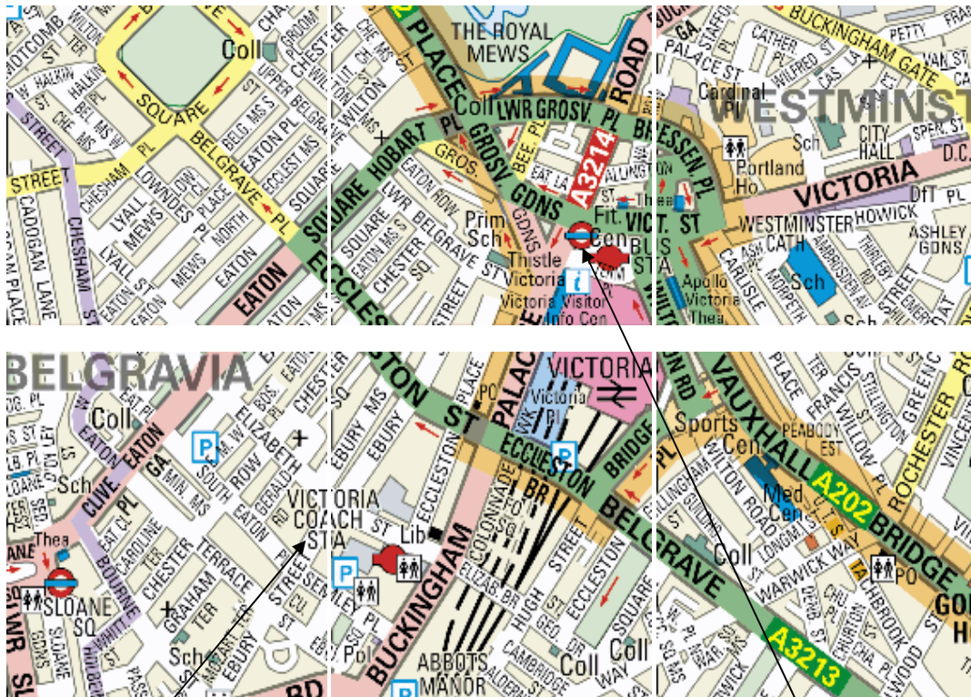
Fig.1. ለንደን ቪክቶሪያ ባቡር ጣቢያ እና አውቶብስ ጣቢያ ( Victoria Underground Train and Coach Station )

የባቡሩን ወይም የአውቶብስን ቲኬት ከዚያው ከአየር ማረፊያው ገዝቶ ተሳፍሮ መምጣት ይቻላል። ሁሉም ባቡሮች ቪክቶሪያ (Victoria Train Station) ወይም ሊቨርፑል መንገድ (Liverpool Street station) ባቡር ጣቢያዎች ሲያደርሱን ሁሉም አውቶብሶች ቪክቶሪያ አውቶብስ ጣቢያ (Victoria Coach Station) ያደርሱናል።