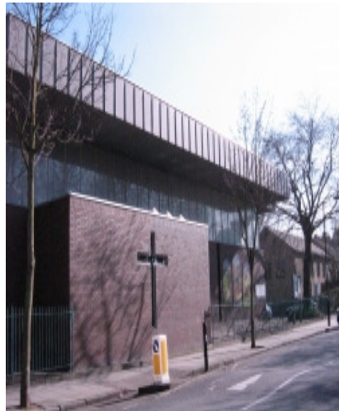
ከአንድ ጎኑ ሲታይ