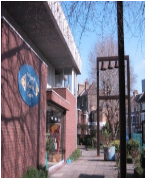
የፊት ለፊት ገጽታው