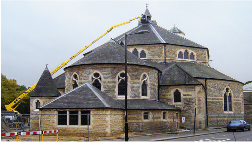
Fig.5, ደብረ ገነት ቅድስት ሥላሴ ቤተ ክርስቲያን አቅራቢያ ሲደርሱ የሚያገኙት ቤተ ክርስቲያን ( The Rock Tower)

ከዚያ እንደ ወረዱ በካርታው መሠረት የቀይ ቀስቱን አቅጣጫ ተከትሎ ሲኒማ ቤቱን ካገኙ በዋላ በዚያው መንገድ (Tufnell park Road) ገባ ብለው ትንሽ ወደ እንደተጓዙ ከላይ ያለውን ቤተ ክርስቲያን ያገኛሉ። ይህ ቤተ ክርስቲያን በአሁኑ ሰዓት ከዚህ በበለጠ ታድሶ ያገኙታል። ከመጡበት አቅጣጫ ቤተ ክርስቲያኑን ፊት ለፊት እያዩ ወደ CLARETON Road በስተግራ ታጥፈው ወደ ፊት በመጓዝ ከሁለት ደቂቃ ባለወበለጠ ጊዜ ቤተ እኛ ቤተ ክርስቲያን በመድረስ ተመስገን ይላሉ።